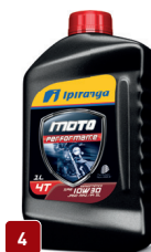
4 IPIRANGA MOTO PERFORMANCE 10W30 SL