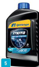
5 IPIRANGA MOTO PERFORMANCE 10W40 SL