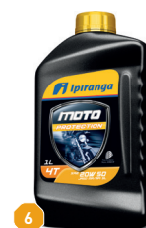
6 IPIRANGA MOTO PROTECTION 20W50 SL