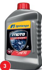
3 IPIRANGA MOTO TOP RIDER 15W50 SN