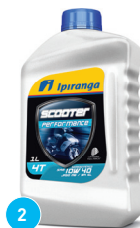
2 IPIRANGA SCOOTER PERFORMANCE 10W40 SL