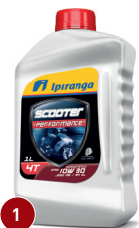
1 IPIRANGA SCOOTER PERFORMANCE 10W30 SL